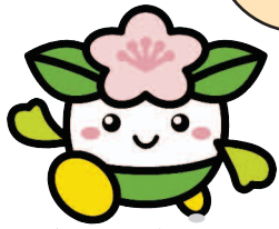
天王寺区マスコットキャラクター 「ももてんちゃん」