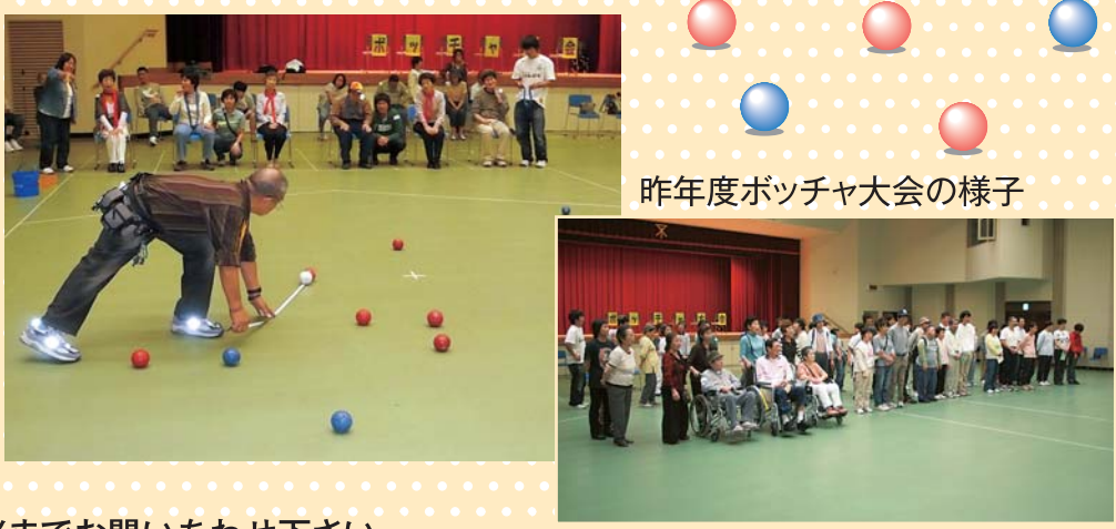
昨年度ポッチャ大会の様子

◎次回は9月14日開催予定です。詳細は担当までお問い合わせ下さい。 主催 天王寺区身体障害者団体協議会 協力 区地域福祉アクションプラン推進委員会 第2部会障がい班