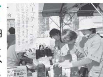
▲区民まつりでの普及啓発活動

保健福祉センター開催の、すこやかフロンティア講座(旧寝たきり予防教室)の修了者の会です。自分が、家族が、地域のみんなが「寝たきりにならない。させない。」をスローガンに、研修会の開催や健康展等での普及啓発活動、健康づくりのための歩育活動の取り組みをしています。