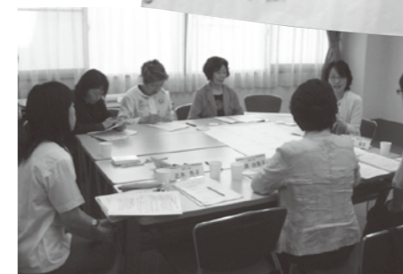
ワークショップによる意見交換