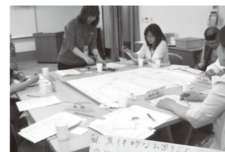
回答結果の整理作業

今後、身体、精神障がい分野の回答についても同様に検討していく予定です。皆さまからいただいた貴重なご意見に基づき検討を行い、関係者と協働しながら障がい班として対応できることには迅速に取り組んでいきたいと思ひます。