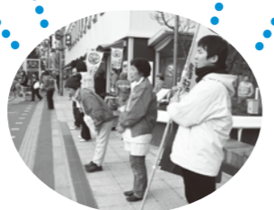
募金総額 (6月末現在) 115万5,592円

一刻も早い被災地の復興を願うとともに、ご協力いただきましたみなさまに心より感謝申し上げます