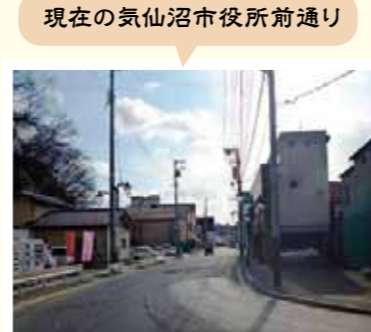
現在の気仙沼市役所前通り