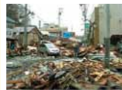
震災直後の市役所前通り

また、みなし仮設住宅(民間の賃貸住宅借り上げ等)への支援の輪も広がっています。ても、被災者の想いは「自分達の生活が本当に戻るのだろうか」不安を抱えながら日々を過ごしています。住民の想いを少しでも受け止めていくことが私達の役割であり、復興への課題だと思っています。