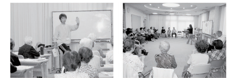
転倒予防について 音楽療法